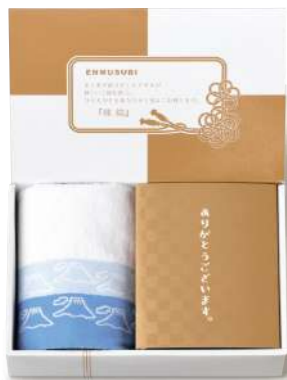
ET-04 縁起の品&今治タオル(青富士)

1,000yen [税込1,080yen] *ウオッシュタオル / 1枚(約34×30cm) *かつお節 / 5袋(3g) *鯛茶漬 / 1袋(6g) [小麦・乳] *かつおふりかけ / 2袋(3.5g) [小麦・乳] *のりたまごふりかけ / 2袋(3.5g) [小麦・卵・乳] *box size / (約)22.8×15.1×h5.8cm *賞味期限 / 365日