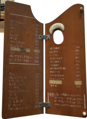
▶ パレットメニュー 創業当時に使われていた絵の具のパレットを元に作られたメニュー表