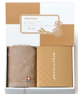
ET-05 縁起の品&今治タオル(ナチュラル)

1,000yen [税込1,080yen] *ウオッシュタオル / 1枚(約34×30cm) *かつお節 / 5袋(3g) *鯛茶漬 / 1袋(6g) [小麦・乳] *かつおふりかけ / 2袋(3.5g) [小麦・乳] *のりたまごふりかけ / 2袋(3.5g) [小麦・卵・乳] *box size / (約)22.8×15.1×h5.8cm *賞味期限 / 365日