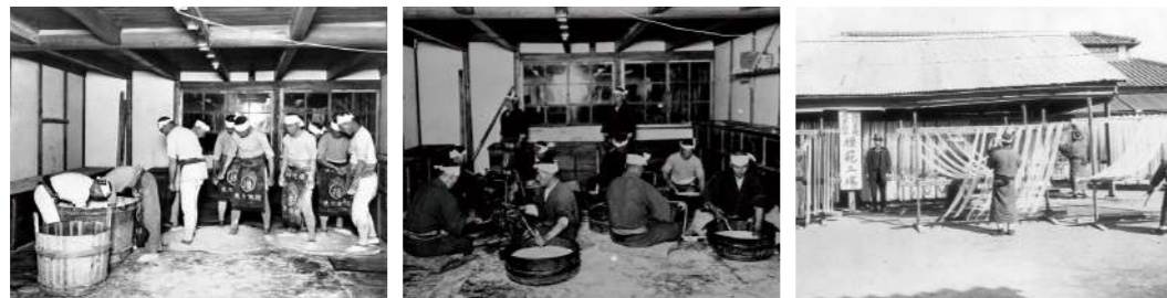
明治時代の貴重な写真

播磨の小京都、龍野で生まれた、特産・揖保乃糸。手延そうめん「揖保乃糸」は、厳選した小麦と赤穂の塩を原料に、そうめん作りに適した豊かな気候風土に育まれてきました。およそ600年受け継がれる伝統の手延製法で、幾度も熟成を重ねながら、職人が丹精込めて作り上げた播州地方の名品です。