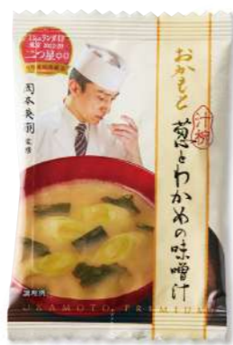
葱とわかめの味噌汁