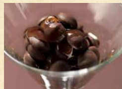
メイプル × ショコラ