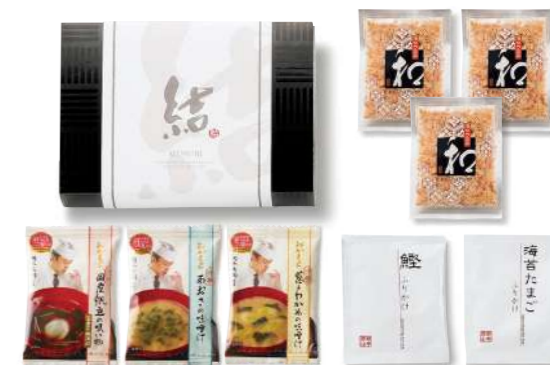
OM-02 おかもとのうまみセット 1,000yen [税込1,080yen]

*帆立の吸い物 / 1袋 (3.9g) [小麦] *あおさの味噌汁 / 1袋 (5.1g) *葱とわかめの味噌汁 / 1袋 (6g) *かつお節 / 3袋 (3g) *かつおふりかけ / 1袋 (3.5g) [小麦・乳] *のりたまごふりかけ / 1袋 (3.5g) [小麦・卵・乳] *box size / (約) 18×12.5×h5cm *賞味期限 / 300日