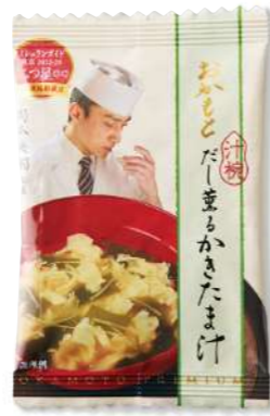
だし薫るかきたま汁