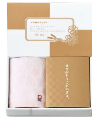
ET-02 縁起の品&今治タオル(なごみ桜)

1,000yen [税込1,080yen] *ウオッシュタオル / 1枚(約34×30cm) *かつお節 / 5袋(3g) *鯛茶漬 / 1袋(6g) [小麦・乳] *かつおふりかけ / 2袋(3.5g) [小麦・乳] *のりたまごふりかけ / 2袋(3.5g) [小麦・卵・乳] *box size / (約)22.8×15.1×h5.8cm *賞味期限 / 365日