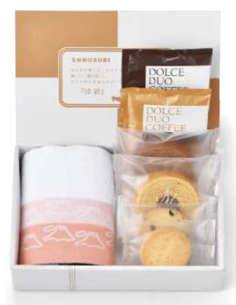
SF-03 王道スイーツ&今治タオル(赤富士) 1,000yen [税込1,080yen] *ウオッシュタオル/1枚(約34×30cm) *ミニバウム/(バナラ・チョコ)各1個(小麦・卵・乳) *クッキー/(チョコチップ・アーモンド)各1枚(小麦・卵・乳) *ドリップ式レギュラーコーヒー/2袋(8g) *box size/(約)22.8×15.1×h5.8cm *賞味期限/30日

引菓子として王道の人気を誇るスイーツアソートに贈り物として不動の地位を確立している今治タオルをセットしました。