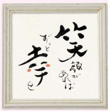
この作品の想いを木箱に込めて...