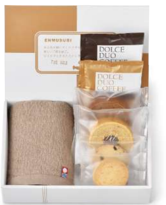
SF-05 王道スイーツ&今治タオル(ナチュラル) 1,000yen [税込1,080yen] *ウオッシュタオル/1枚(約34×30cm) *ミニバウム/(バナラ・チョコ)各1個(小麦・卵・乳) *クッキー/(チョコチップ・アーモンド)各1枚(小麦・卵・乳) *ドリップ式レギュラーコーヒー/2袋(8g) *box size/(約)22.8×15.1×h5.8cm *賞味期限/30日