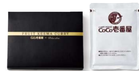
CO-01 CoCo壱番屋のキーマカレー 1,000yen [税込1,080yen] *レトルトカレー/1袋(180g) [小麦・乳・落花生] *box size/(約)13.2×17.2×h2.8cm *賞味期限/365日 卵不使用

お店では食べられないオリジナルレシピのキーマカレーは豚挽肉とフルーツチャツネを組み合わせた、濃厚でフルーティーなカレーです。