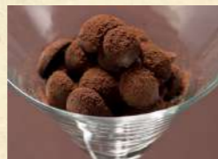
ショコラ × ショコラ