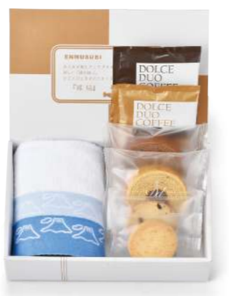
SF-04 王道スイーツ&今治タオル(青富士) 1,000yen [税込1,080yen] *ウオッシュタオル/1枚(約34×30cm) *ミニバウム/(バナラ・チョコ)各1個(小麦・卵・乳) *クッキー/(チョコチップ・アーモンド)各1枚(小麦・卵・乳) *ドリップ式レギュラーコーヒー/2袋(8g) *box size/(約)22.8×15.1×h5.8cm *賞味期限/30日