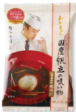
国産帆立の吸い物