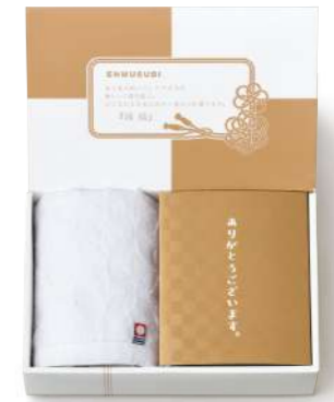
ET-01 縁起の品&今治タオル(七宝つむぎ)

1,000yen [税込1,080yen] *ウオッシュタオル / 1枚(約34×30cm) *かつお節 / 5袋(3g) *鯛茶漬 / 1袋(6g) [小麦・乳] *かつおふりかけ / 2袋(3.5g) [小麦・乳] *のりたまごふりかけ / 2袋(3.5g) [小麦・卵・乳] *box size / (約)22.8×15.1×h5.8cm *賞味期限 / 365日