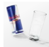
Red Bull 038