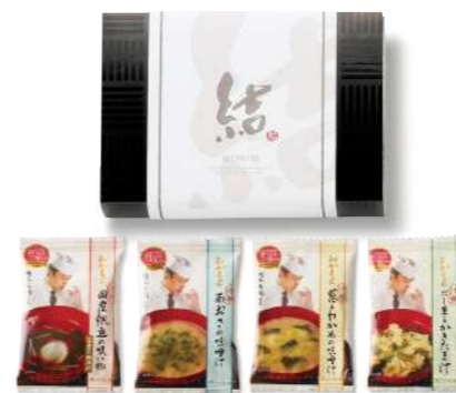
OM-01 おかもとのあじわいセット 1,000yen [税込1,080yen]

*帆立の吸い物 / 1袋 (3.9g) [小麦] *あおさの味噌汁 / 1袋 (5.1g) *葱とわかめの味噌汁 / 1袋 (6g) *かきたま汁 / 1袋 (6.4g) [小麦・卵] *box size / (約) 18×12.5×h5cm *賞味期限 / 300日