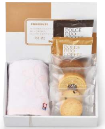
SF-02 王道スイーツ&今治タオル(なごみ桜) 1,000yen [税込1,080yen] *ウオッシュタオル/1枚(約34×30cm) *ミニバウム/(バナラ・チョコ)各1個(小麦・卵・乳) *クッキー/(チョコチップ・アーモンド)各1枚(小麦・卵・乳) *ドリップ式レギュラーコーヒー/2袋(8g) *box size/(約)22.8×15.1×h5.8cm *賞味期限/30日