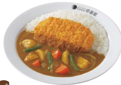
◀ ロースカツやさい 定番のロースカツとやさいを組み合わせた人気のメニュー

1994年5月には国内店舗は300店舗に達し、全国47都道府県への出店を果たしました。そして、2004年12月に1000店舗を達成し、現在は日本国内のみならず、アジア、アメリカ、イギリスと世界の国々に店舗を広げ、国内外に約1440店舗(国内約1240店舗、海外約180店舗)を展開しています。2019年6月には、世界最大のカレーの消費国であるインドに現地法人を設立(株式会社壱番屋の出資比率は40%)し、カレーの祖国への里帰りを目指して出店の準備を進めています。