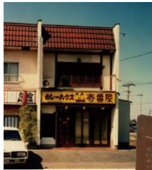
▲ 1号店 名古屋市郊外の西枇杷島町の田んぼの真ん中に1号店をオープン