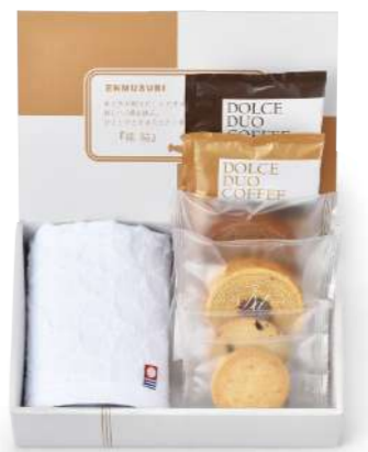
SF-01 王道スイーツ&今治タオル(七宝つむぎ) 1,000yen [税込1,080yen] *ウオッシュタオル/1枚(約34×30cm) *ミニバウム/(バナラ・チョコ)各1個(小麦・卵・乳) *クッキー/(チョコチップ・アーモンド)各1枚(小麦・卵・乳) *ドリップ式レギュラーコーヒー/2袋(8g) *box size/(約)22.8×15.1×h5.8cm *賞味期限/30日