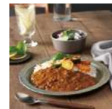
カレーハウス CoCo壱番屋 034